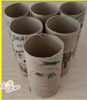
Boliche com rolinho de papel